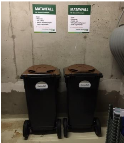
Kärl för matavfall 24ans soprum ingång cykelrummet

Papperspåsar, fyllda med matavfall, ska läggas i de anvisade kärlen för matavfall, som står uppställda i ovan nämnda soprum och kommer tömmas regelbundet. Här kommer det även finnas fler papperspåsar att hämta allt eftersom de förbrukas.